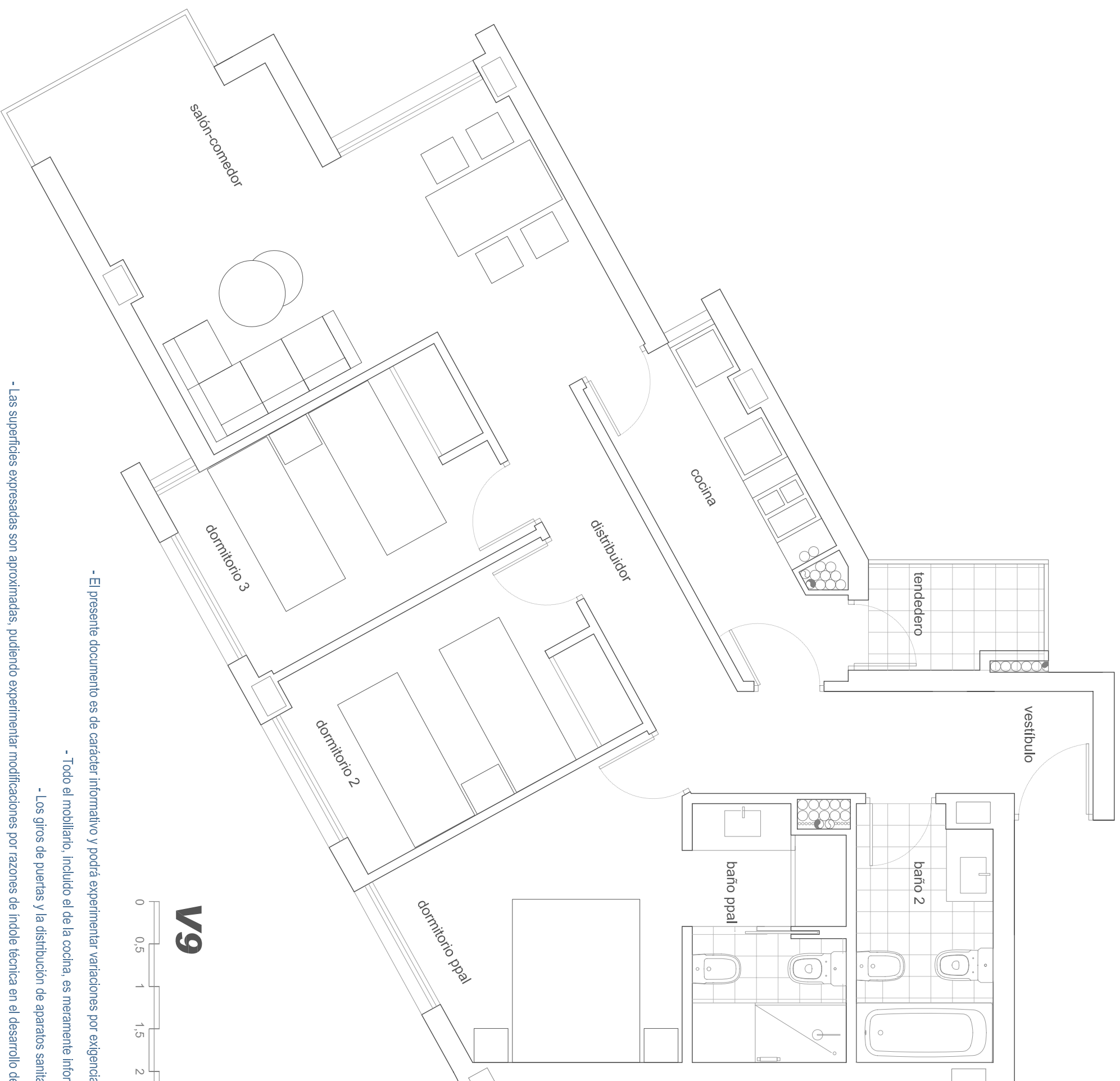
V9 e: 1/50 0 0,5 1 1,5 2 3